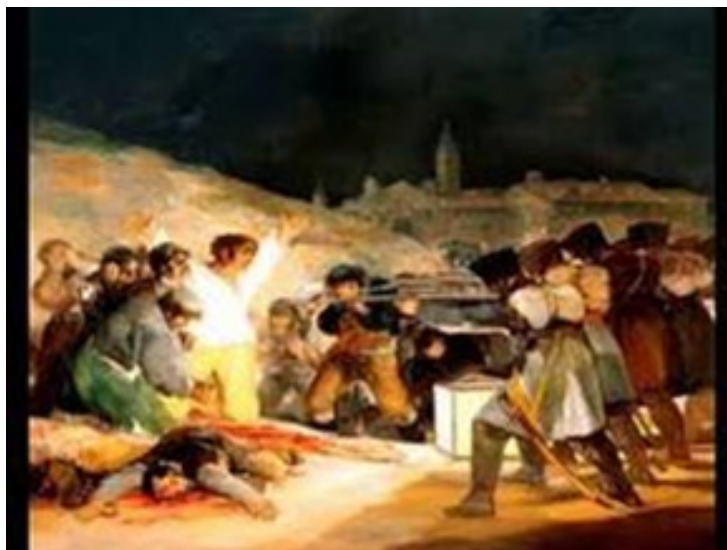
Fusilamientos del 3 de mayo (Obra de Francisco de Goya)

El primer paso en dicha dirección era la redacción de una constitución . Promulgada en Cádiz el 19 de marzo de 1812 –festividad de San José–, el pueblo no tardó en bautizarla como La Pepa. Su principal aportación fue el reconocimiento del principio de soberanía nacional. Ninguna persona o familia podía ostentar el poder sin sujetarse a las leyes constitucionales, lo que afectaba claramente al Rey. Para poder ser investido como nuevo rey de España, Fernando VII debió jurar lealtad a la constitución. Así lo hizo, aunque tiempo después rompió el juramento y de nuevo España volvió a un sistema de monarquía absoluta.