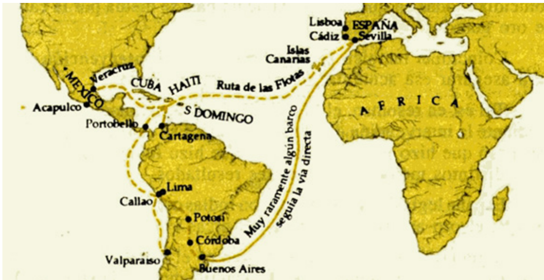
Mapa del mercantilismo español

3. La expansión del poderío naval: La expansión del poderío naval era esencial para garantizar las comunicaciones marítimas entre las metrópolis europeas y sus imperios coloniales. En el siglo XV, Portugal ejerció una supremacía naval; en el siglo XVI, esta pasó a España; en el siglo siguiente, a Holanda; y finalmente en el siglo XVIII, esta pasó a Inglaterra “La reina de los mares”.